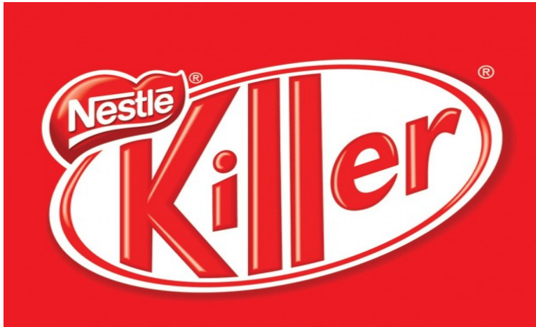
Figuur 4. Het actielogo dat Greenpeace heeft gebruikt in de Nestlé campagne

Handtekeningen en daarmee publieke druk zijn vaak nodig om een producent aan de tafel te krijgen om te onderhandelen over mogelijke alternatieven. De inzet van sociale media kan veel reacties oproepen in een korte tijd. Voldoende capaciteit is nodig om die adequaat te kunnen verwerken. Vragen komen vanuit het publiek, maar ook van politici en zelfs wetenschappers meldden zich geregeld bij Greenpeace om uitleg. Het is belangrijk dat de boodschap die wordt uitgezonden via Twitter of YouTube voldoende is onderbouwd. Greenpeace maakt eerst een ketenanalyse. In de Nestlé casus beginnend bij de palmolieproducenten en concessiehouders tot de gebruikers van de palmolie in voedings- en cosmetica-industrie. Ook geeft de organisatie aan welke alternatieven er zijn.