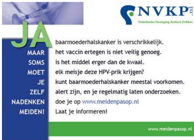
Figuur 5. Poster aangeboden door Vereniging Kritisch Prikken aan doelgroep voor HPV-campagne.